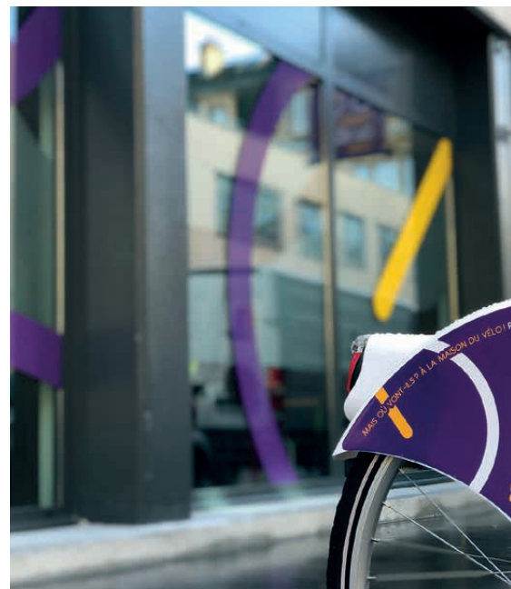
LA MAISON DU VÉLO / RUE CLAUDE CHARLES

Toute opération de rénovation de voirie engagée par la Ville ou la Métropole comprend systématiquement une prise en compte des besoins liés à la circulation à deux roues.