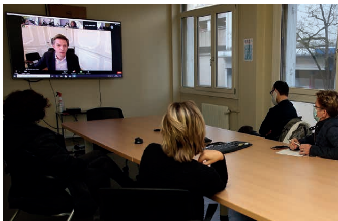
VISIOCONFÉRENCE ENTRE LE MAIRE ET LES SERVICES MUNICIPAUX

La crise sanitaire a eu pour effet de développer le travail à distance. Certes, pour certains cette situation fut difficile mais pour d'autres, elle fut une opportunité de découvrir et d'apprécier une nouvelle façon de travailler. De cette expérience, de nouveaux usages émergent : limitant les trajets domicile-travail, le nombre de supports imprimés, remplaçant les déplacements professionnels par des visio-conférences. Depuis, pour tout renouvellement du parc informatique la priorité est donnée à l'achat d'ordinateurs portables facilitant le travail depuis le domicile. L'administration se réinvente pour des conditions de travail plus respectueuses de l'environnement.