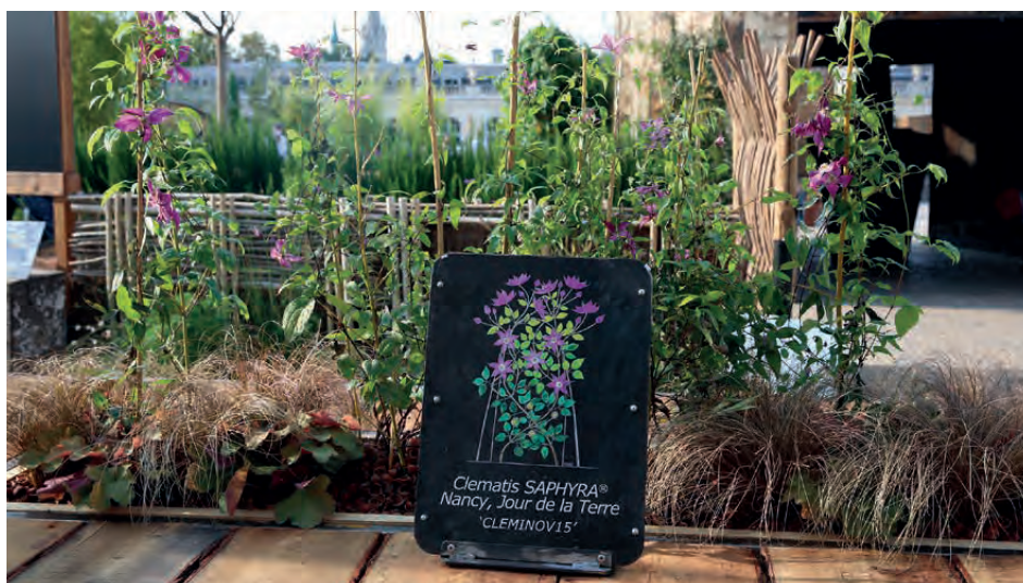
CLÉMATITE « NANCY JOUR DE LA TERRE »