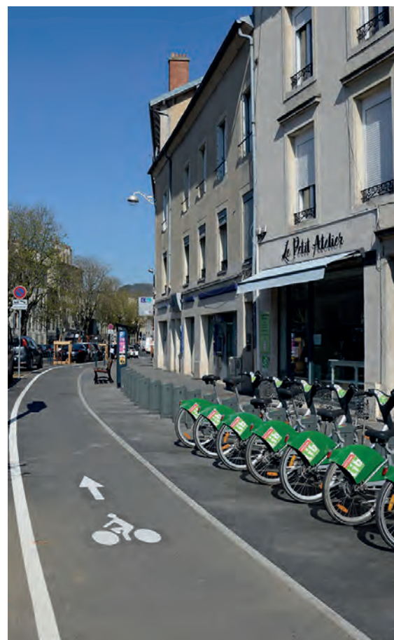
PISTE CYCLABLE / FAUBOURG DES TROIS MAISONS