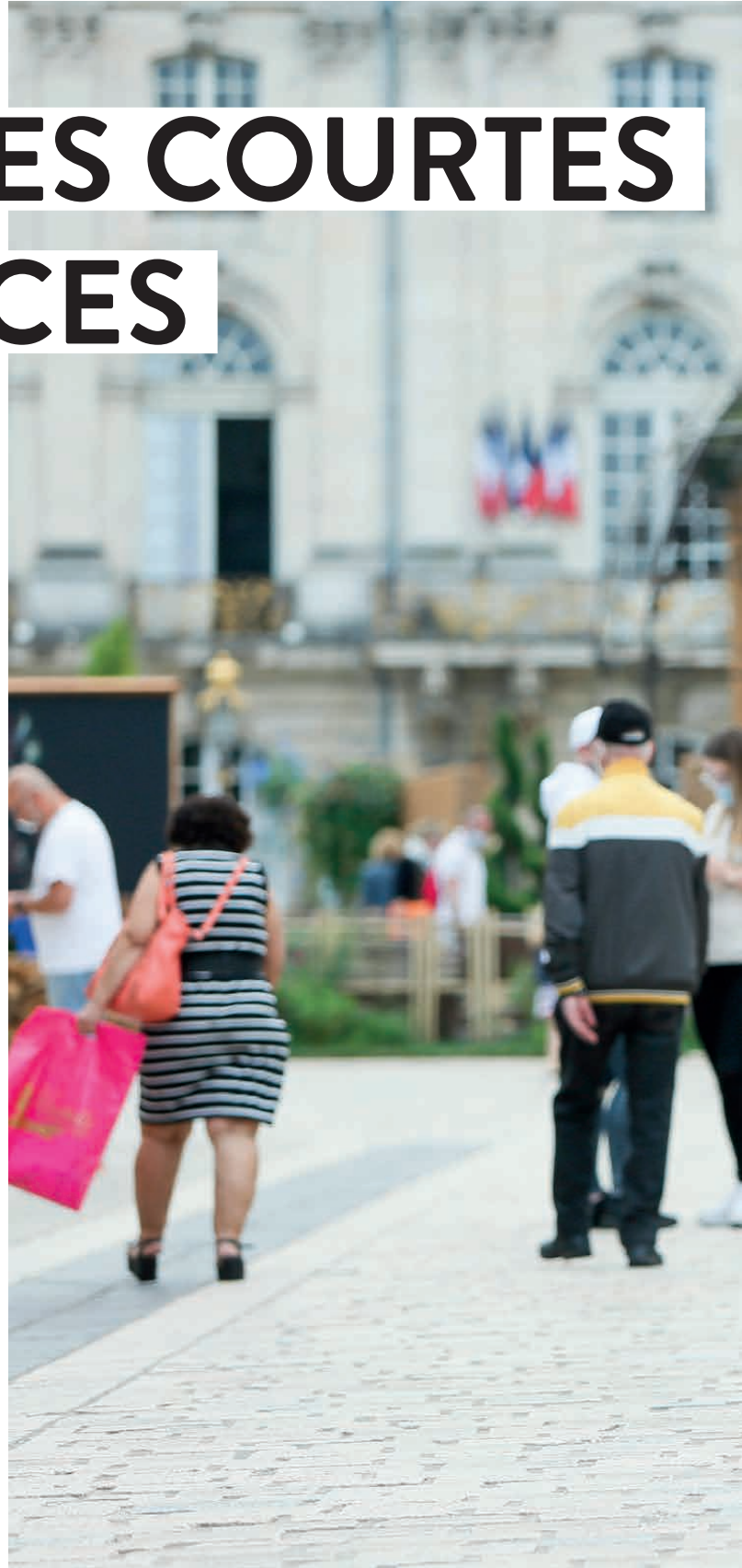
PLACE STANISLAS / SEPTEMBRE 2020

À l'heure des enjeux de transition écologique, la Ville de Nancy engage un travail de fond pour mieux organiser le partage de l'espace public entre la voiture, le piéton et le cycliste tout en laissant une nouvelle place à la nature et l'eau en ville. C'est la condition nécessaire pour améliorer significativement la qualité de vie et renouveler l'attractivité urbaine.