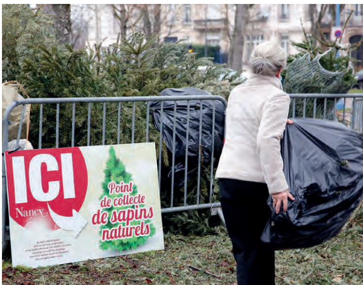
LES HABITANTS DÉPOSENT LEUR SAPIN NATUREL SUR L'UN DES 9 SITES DE RÉCUPÉRATION DE LA VILLE

LA COLLECTE DE SAPINS NATURELS APRÈS LES FÊTES EST UN BEL EXEMPLE DE RÉUTILISATION ET DE VALORISATION DE DÉCHETS À L'ÉCHELLE DE LA COMMUNE.