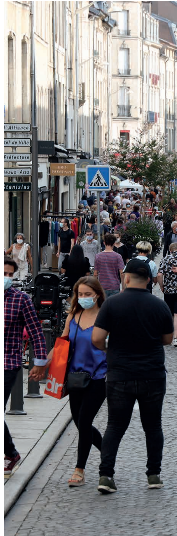
OPÉRATION "BEAU WEEK-END" SEPTEMBRE 2020

Les études de faisabilité, circulation et stationnement sont engagées par la Ville et la Métropole pour identifier les solutions fonctionnelles et d'aménagement qui seront discutées lors des phases de concertation.