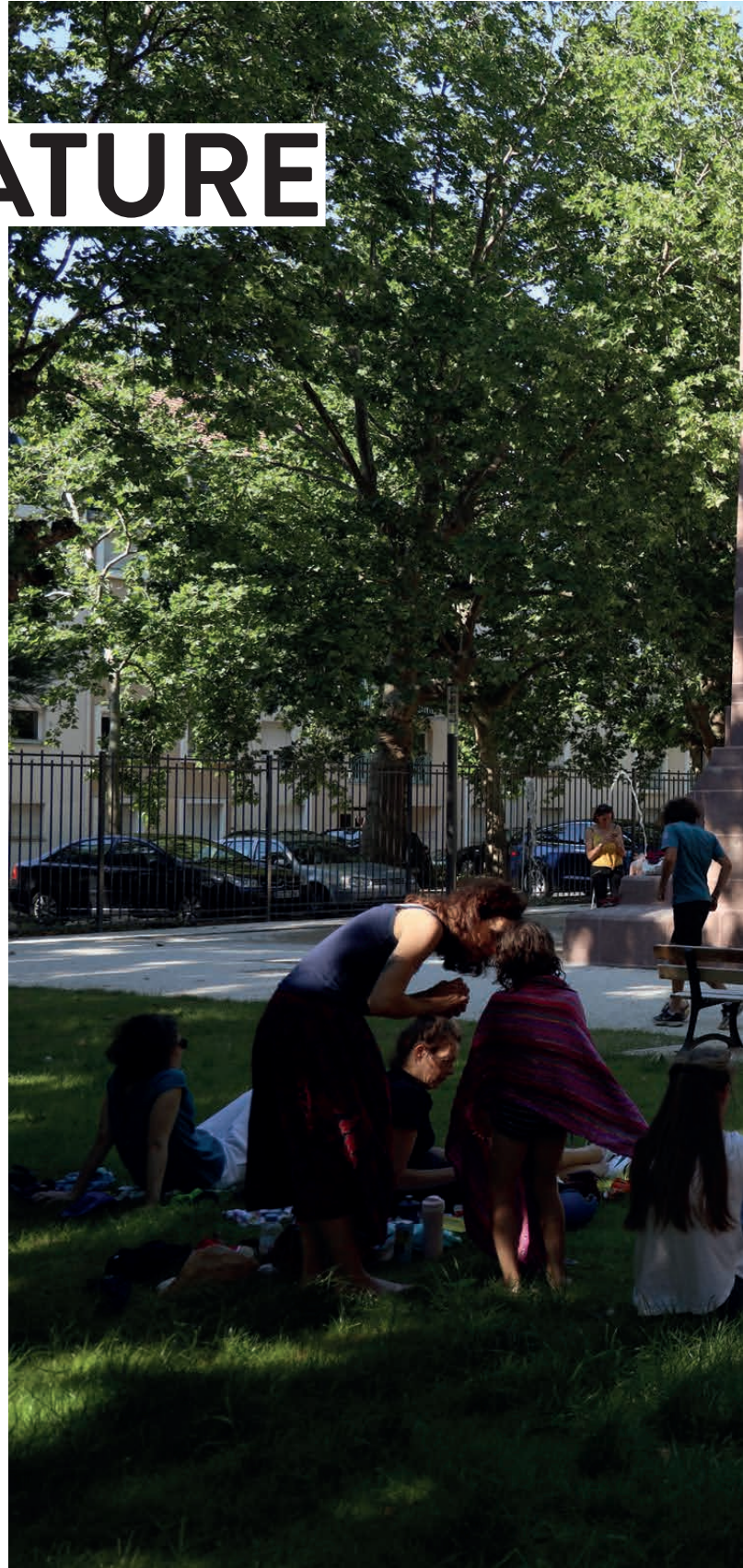
PLACE DE LA CROIX DE BOURGOGNE

En proposant des éco ateliers aux citoyens, en expérimentant dans ces espaces verts de nouveaux végétaux économes en eau, en faisant du végétal une priorité dans les projets d'aménagements urbains, elle préserve la biodiversité et le circuit de l'eau et tend à réduire les pics de température.