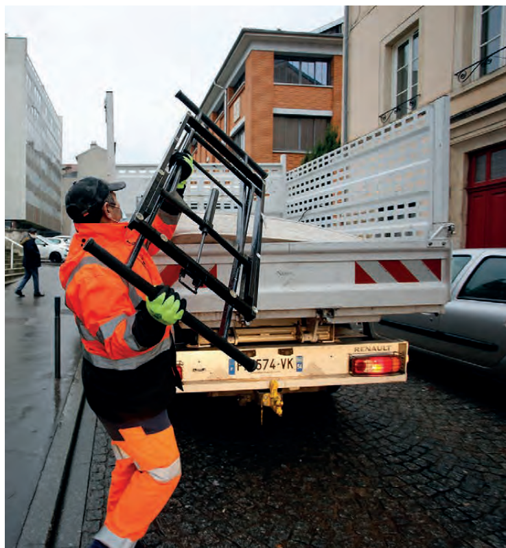
INTERVENTION DE LA BRIGADE NANCY VILLE PROPRE