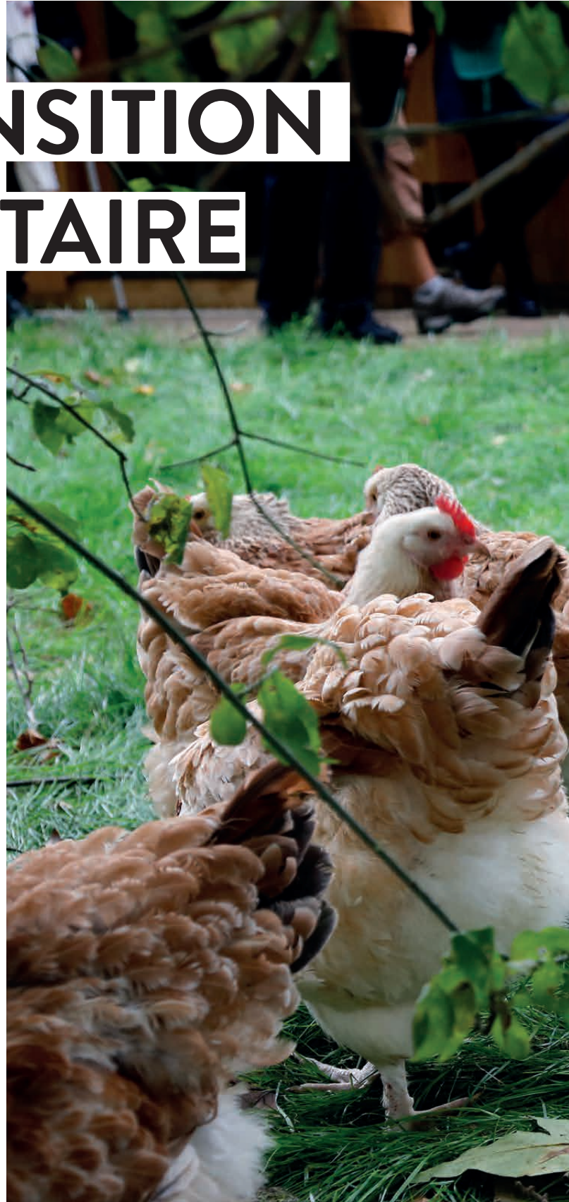
POUAILLER PARTAGÉ / PARC DE LA PÉPINIÈRE

Fervente défenseuse du bien manger, la Ville de Nancy s'engage à offrir aux usagers des structures de restauration collective des matières premières de qualité à une tarification adaptée. Filières labellisées, approvisionnement local, produits bio et de saison... Autant de mesures fortes fondées sur un partenariat durable avec les producteurs locaux.