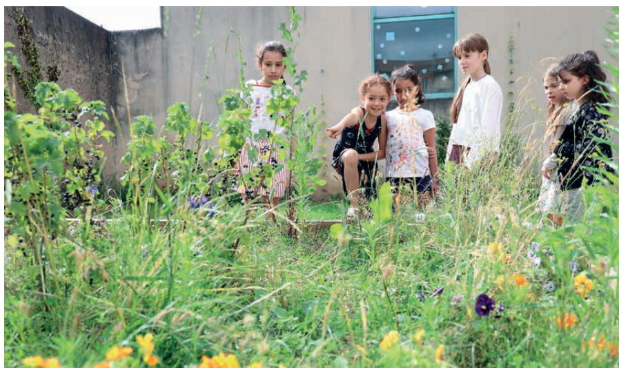
COUR D'ÉCOLE VÉGÉTALISÉE / TROIS MAISONS

La réussite du projet repose sur l'implication pleine des usagers dans la définition du projet d'aménagement. La méthodologie a été construite en partenariat avec le CAUE 54 et les premières concertations ont débuté en décembre 2020, pour permettre la réalisation des premières cours à l'été 2021.