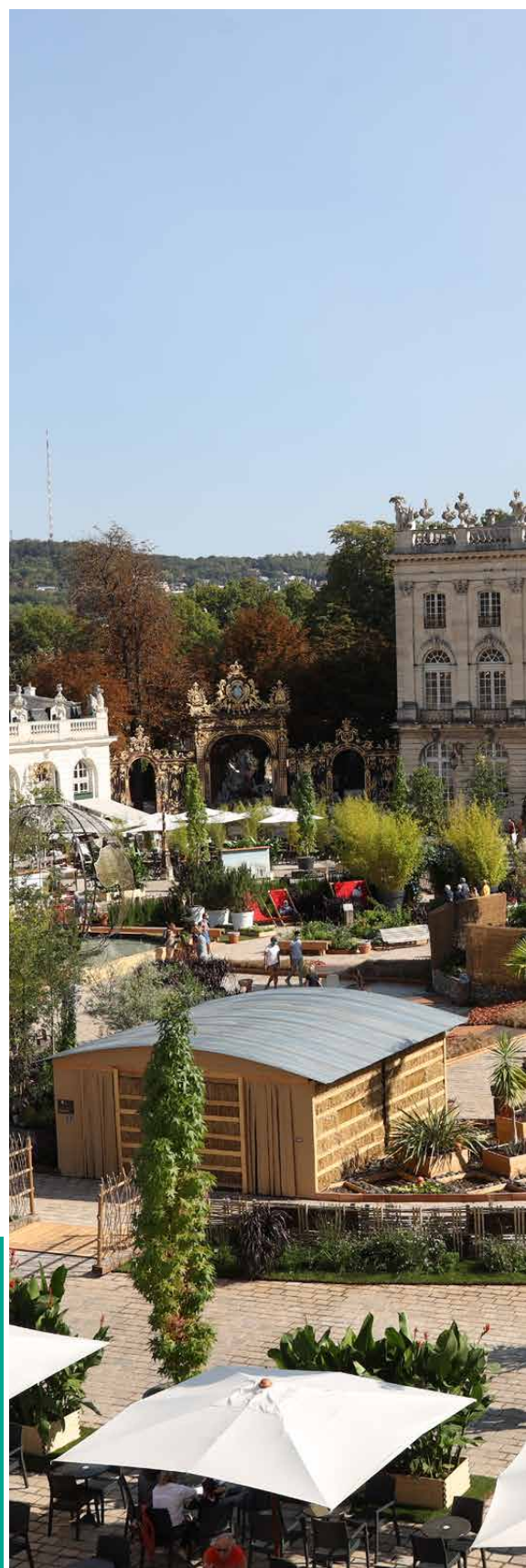
JARDIN ÉPHÉMÈRE 2020

La ville de Nancy a lancé, en septembre 2020, son projet de végétalisation des cours d'écoles. Avec un objectif : consulter tous les usagers et co-construire avec eux des espaces plus écologiques, plus agréables et partagés par les enfants.