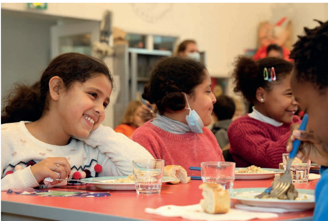
RESTAURATION COLLECTIVE / NOVEMBRE 2020

Enfin, dans le cadre du renouvellement du marché de délégation de service public de la restauration collective, un cabinet d'expert a également été missionné en tant qu'assistant à maîtrise d'ouvrage pour déterminer le mode de gestion le plus efficace pour atteindre ses objectifs de qualité.