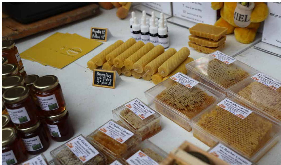
STAND DE PRODUITS ISSUS DE CIRCUIT COURT / CAMPAGN'ART 2019