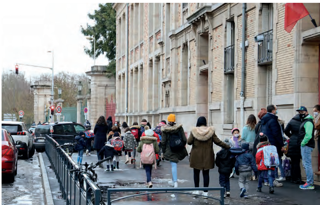
TRAVAUX EFFECTUÉS À L'ÉCOLE BRACONNOT EN 2020

Ainsi, des propositions d'amélioration ont été formulées. Elles consistent en des travaux de voirie pour sécuriser les zones à proximité de l'école, une campagne de communication sur les modes doux pour les trajets scolaires à destination des écoles, et l'utilisation d'application de co-piétonnage telles que « Cmabulle » pour mettre en relation les parents intéressés (application mise à disposition gratuitement par Keolis).