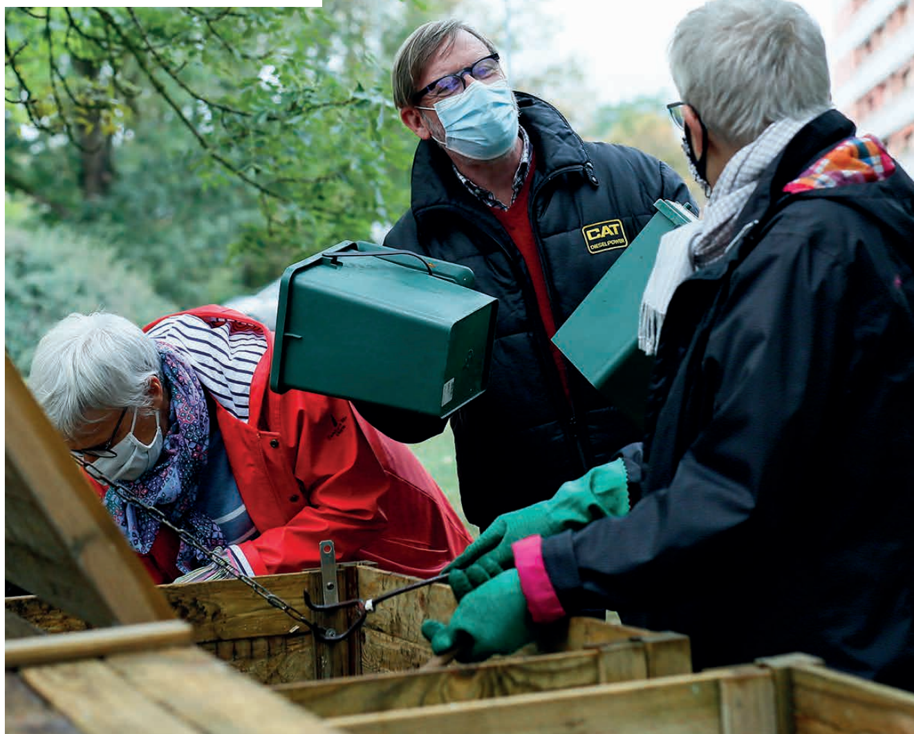
SITE DE COMPOST PARTAGÉ