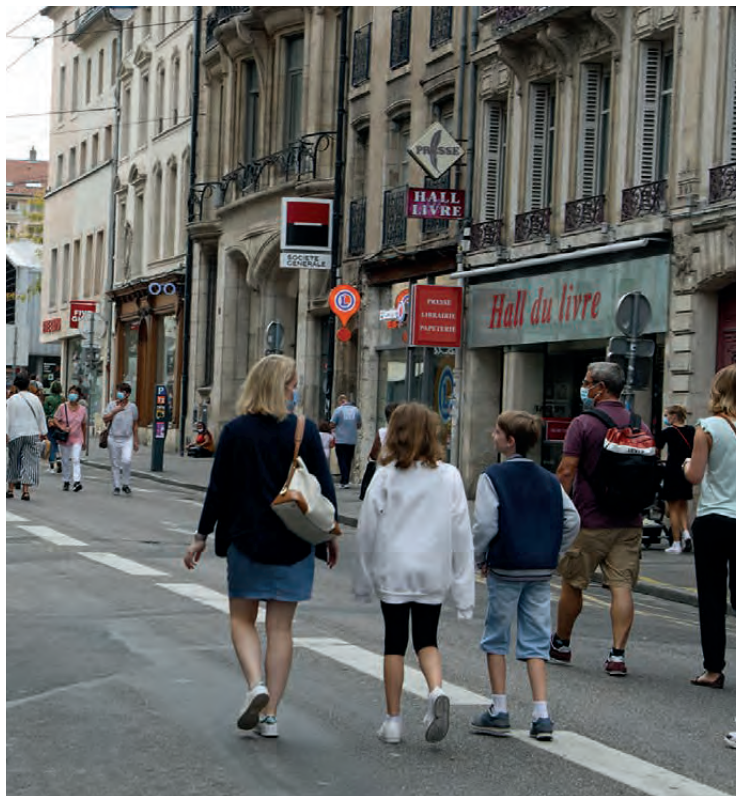
OPÉRATION "BEAU WEEK-END" SEPTEMBRE 2020