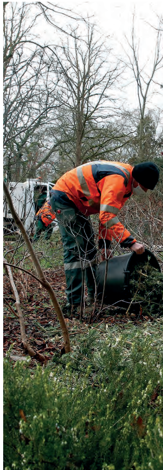
LES AGENTS MUNICIPAUX DÉPOSENT LE PAILLAGE DANS LES ESPACES VERTS