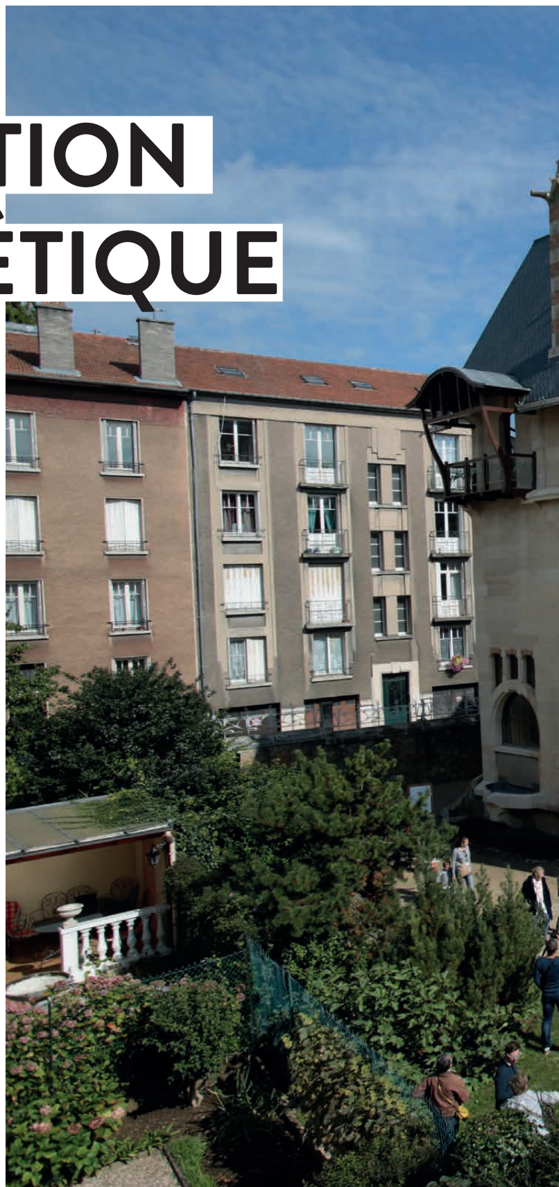
LA VILLA MAJORELLE, UN EXEMPLE DE RÉNOVATION ÉNERGÉTIQUE