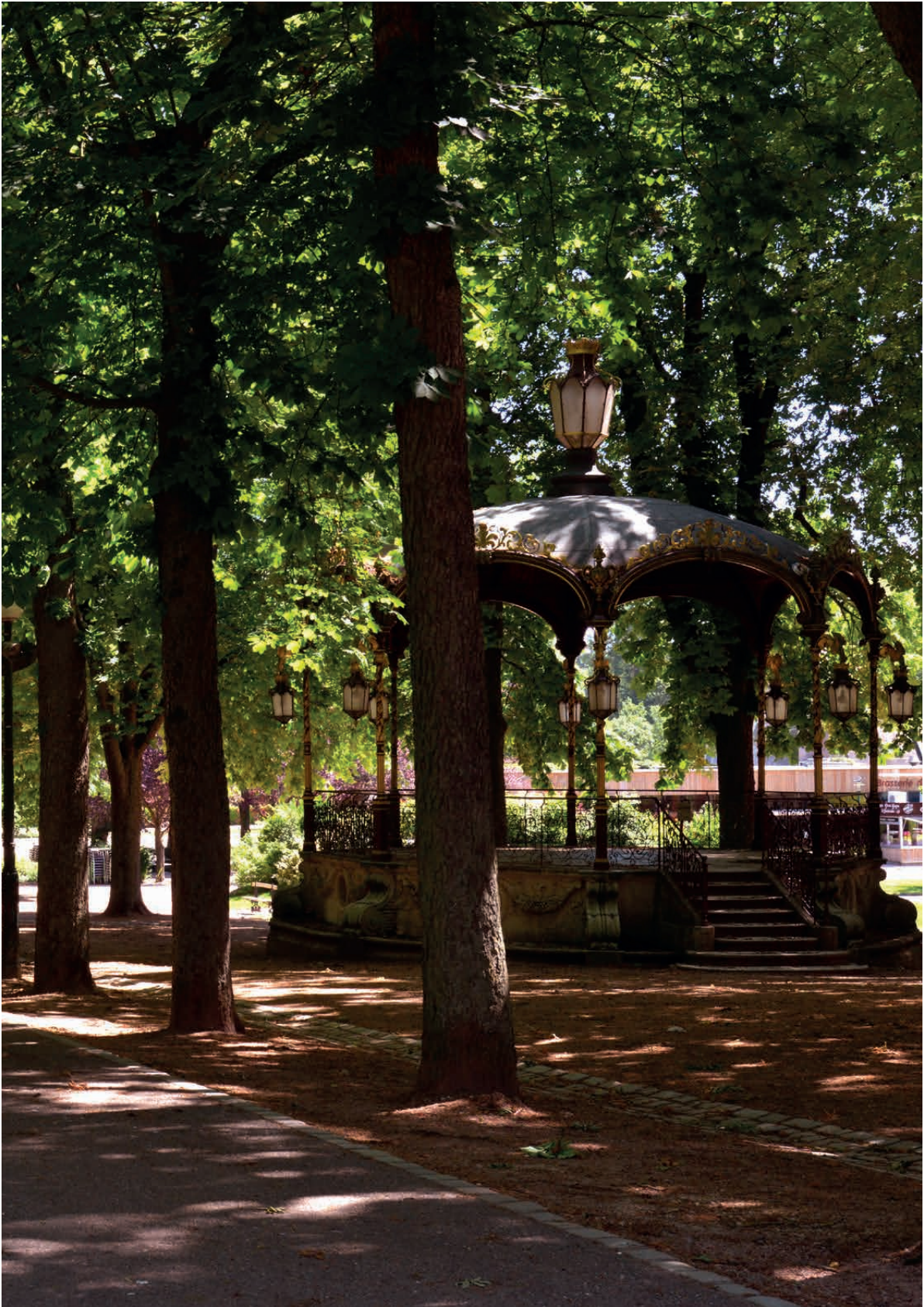
PARC DE LA PÉPINIÈRE