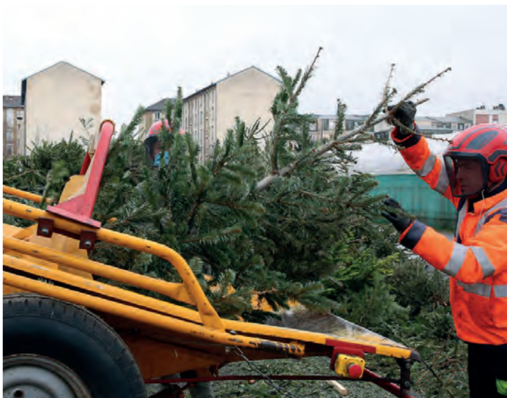
LES AGENTS MUNICIPAUX PROCÈDENT AU BROYAGE DES ARBRES COLLECTÉS