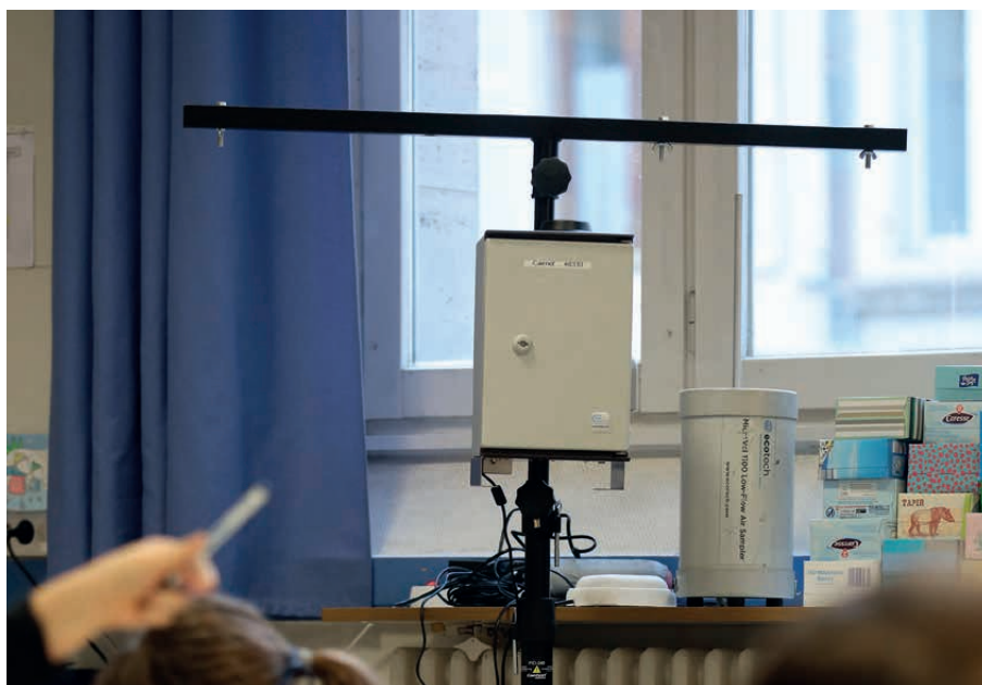
SONDES DE MESURE DE QUALITÉ DE L'AIR EXTÉRIEUR ET INTÉRIEUR À L'ÉCOLE BRACONNOT

L'enjeu de ce projet est de réinterroger les pratiques de manière éclairée et pragmatique et d'amplifier le passage à l'action.