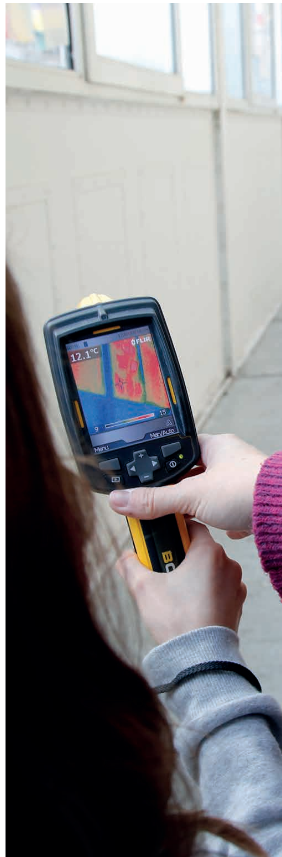
ECOLE À ÉNERGIE POSITIVE