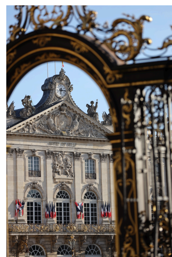
Place Stanislas- Hôtel de ville et grilles de Jean Lamour (détail)

Cette œuvre est une intégration architecturale, composée d'un néon jaune fragmenté en quatre parties accrochées aux angles de l'extension contemporaine du musée. Il n'y a pas de sens de lecture particulier. Morellet reprend les lignes végétales ou minérales des grilles forgées de la place Stanislas, chefs-d'œuvre de Jean Lamour, ferronnier du dernier duc de Lorraine qui sut jouer de toutes les courbes et volutes de l'art rocaille. Soulignant l'apport du passé dans la création artistique d'aujourd'hui, l'artiste instaure un dialogue entre ce joyau de l'urbanisme du XVIIIème siècle et l'architecture contemporaine.