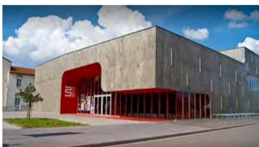
L'Autre Canal, Nancy

Classes accueillies : 2 classes de la GS au CP