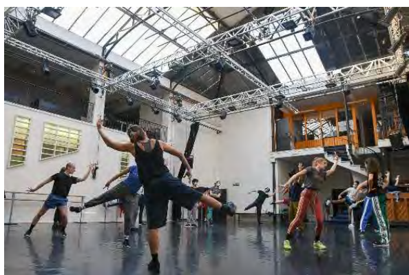
Répétitions des danseurs du Ballet de Lorraine

Classes accueillies : CP uniquement (2 classes maxi)