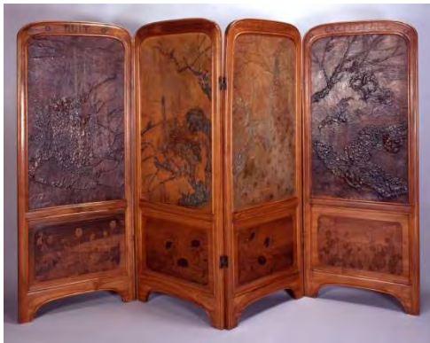
Madeline Deville, Paravent Le jour et la nuit , 1903

Classes accueillies : 3 classes de CE1/CE2