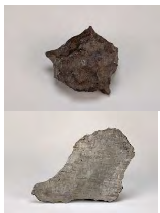
Météorites, Féru des Sciences, Jarville-la-Malgrange

Classe accueillies : classes de CE1 à CM2 (pas de limite d'inscription)