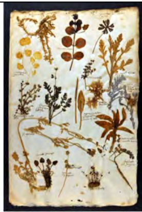
Herbier Dominique Perrin, Jardin Botanique J.-M. Pelt

Classes accueillies : 2 classes de CM1/CM2