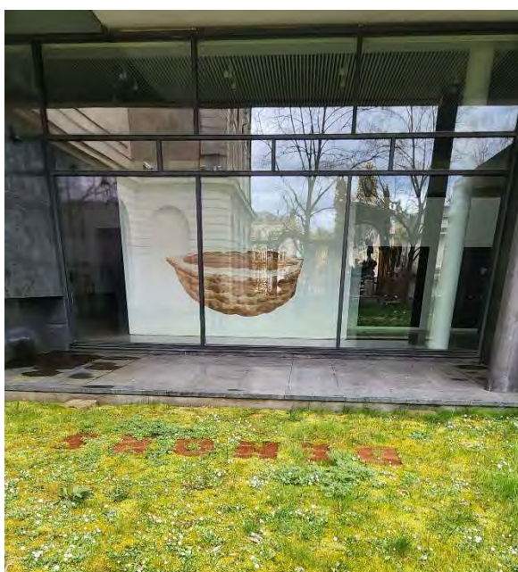
Estelle Chrétien, Coque et Dehors , 2024

Le parcours se déroulera en trois temps.