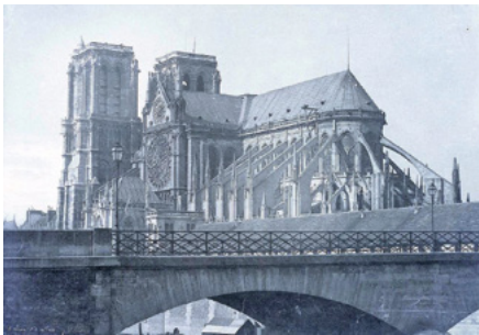
© Henri le Secq - Notre-Dame - 1851

Informations : nancy.archi.fr Entrée libre